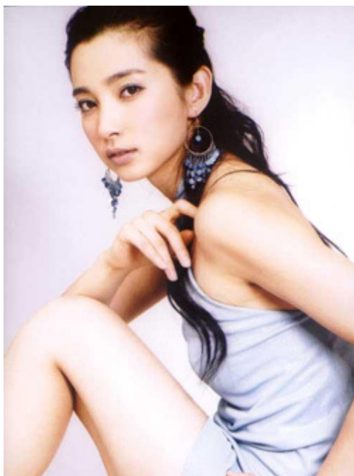
面相算命图解之面相耳朵：耳朵硬性格会倔强