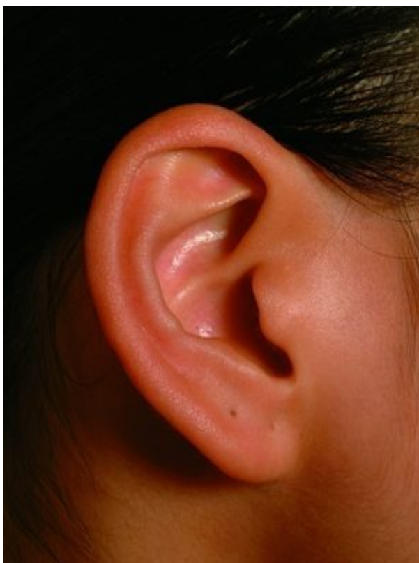
面相算命图解之面相耳朵：耳色过红多谋少成

第一、耳白过面，一定要莹白润白，这样的人聪明超常， 贵人 多多，事半功倍。如果耳形好，从小开始走运。