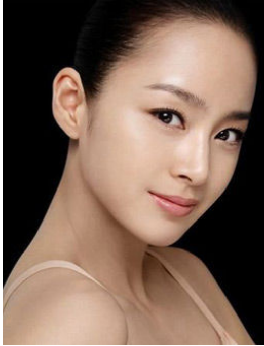
面相算命图解之面相耳朵：耳内生毫，寿高