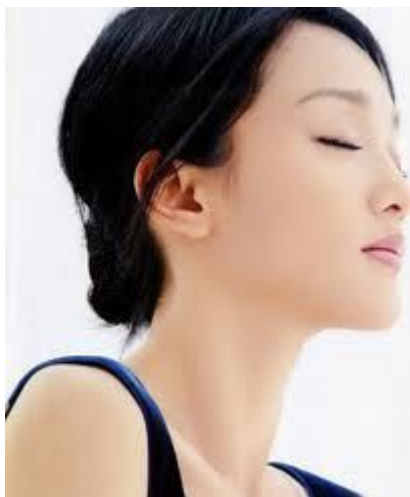
面相算命图解:耳色

耳朵虽然有很多形状，但是，无论再差的耳形，颜色是第一位的。甚至可以说，颜色要远胜过形状。所以古语说：耳形虽善，色泽不明，未为善。