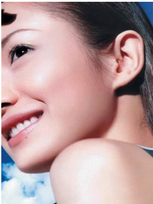
面相耳朵：耳轮有痣，聪明