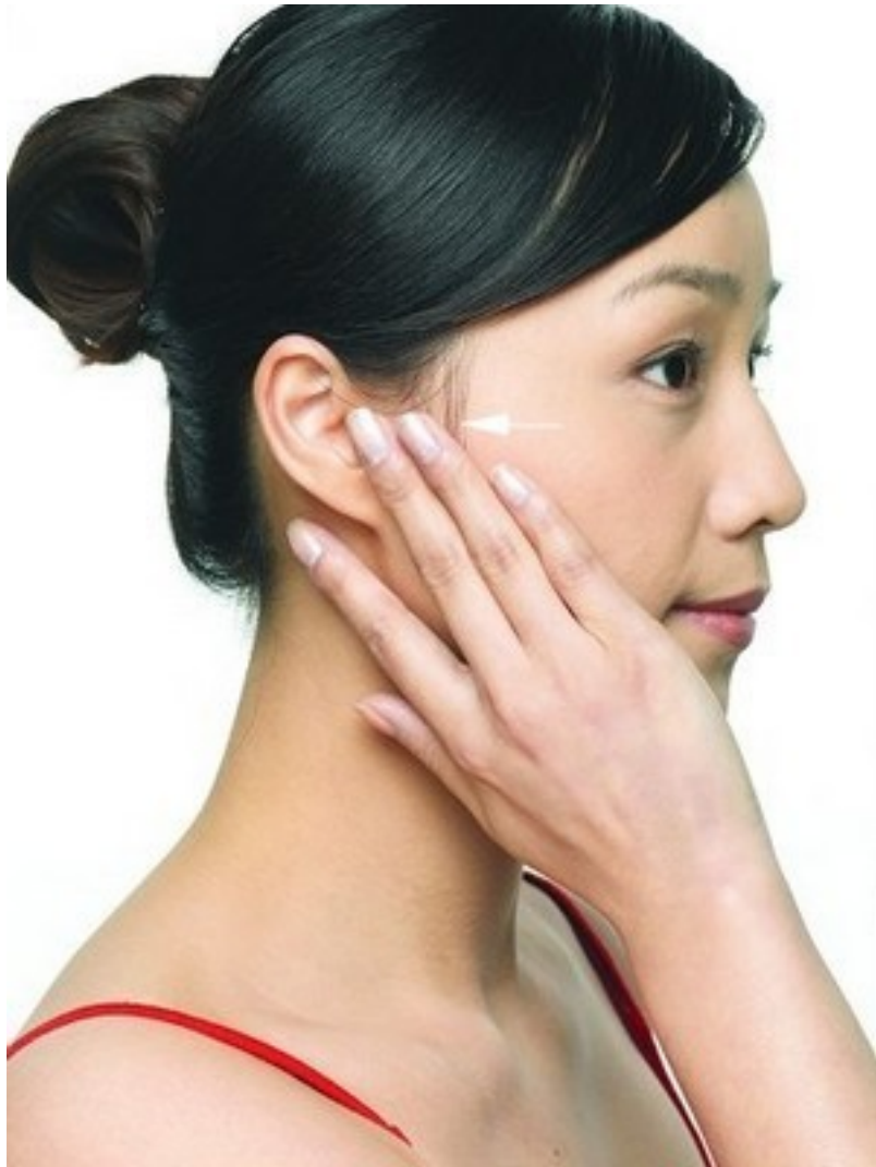
面相算命图解之面相耳朵：耳朵蒙尘在走衰运

第二、耳朵红润，红润是常色，没什么好坏。但说明最近 运程 很顺。最忌淤红，多谋少成。