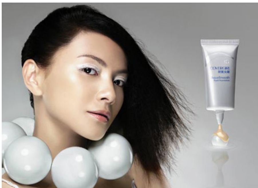
面相算命图解之面相耳朵：没有耳垂，是运动型的