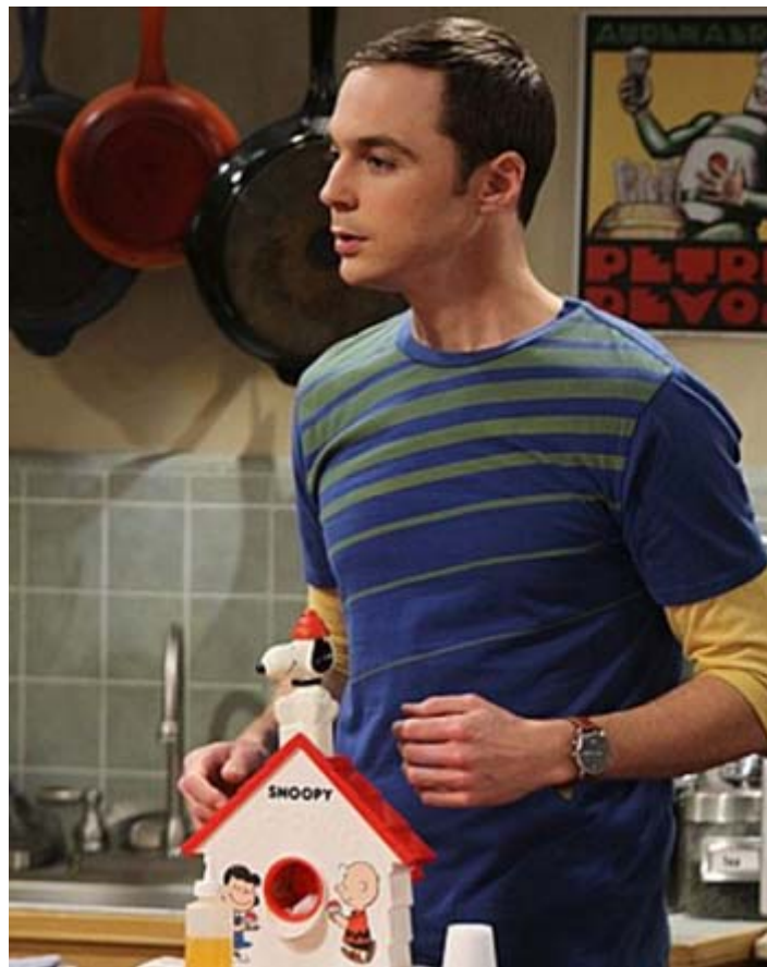
面相算命图解之面相耳朵：轮廓不正的人